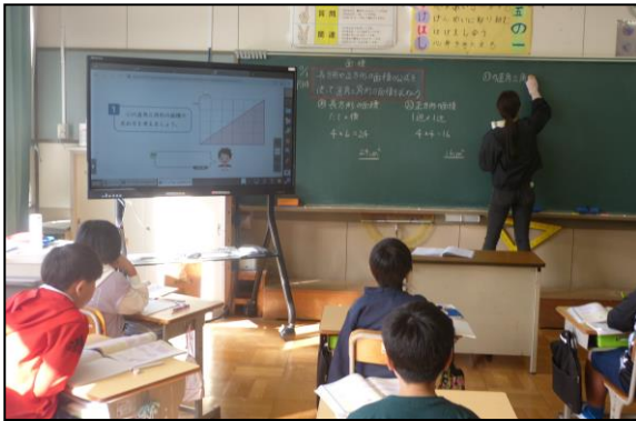
電子教科書で問題の内容を確認