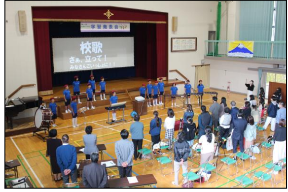
指揮でもたくさんの児童が活躍しました