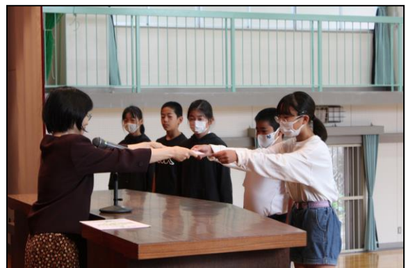
続いて、後期委員会の任命状が授与されました