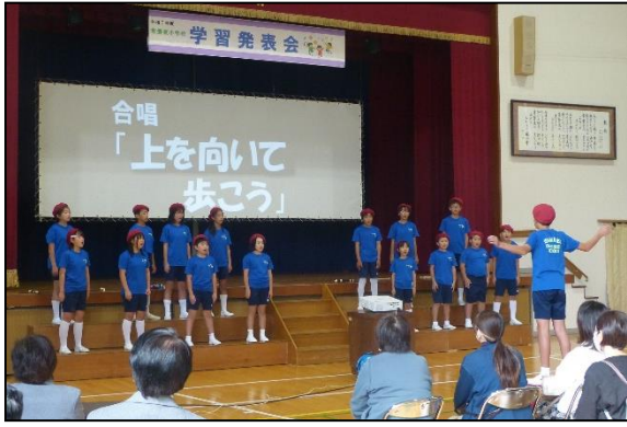
5・6年「音のパラダイス」