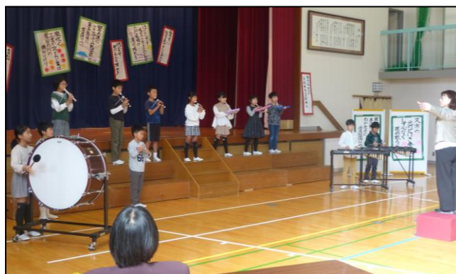
3・4年生 「ふれよう！歌おう！日本の四季」