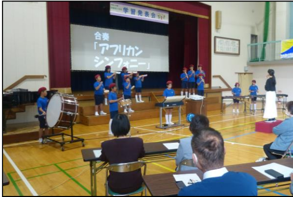
圧巻の合奏「アフリカンシンフォニー」