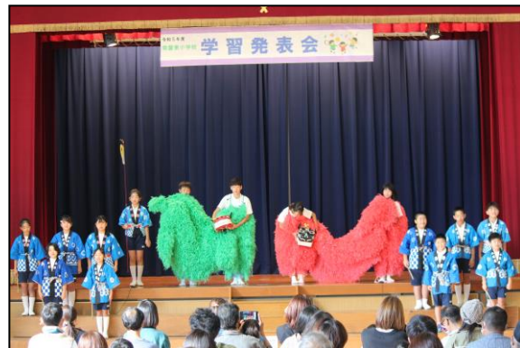
緊張したけど、頑張りました