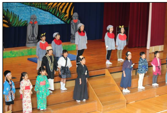
観客の心を打つような大きくていい声でした