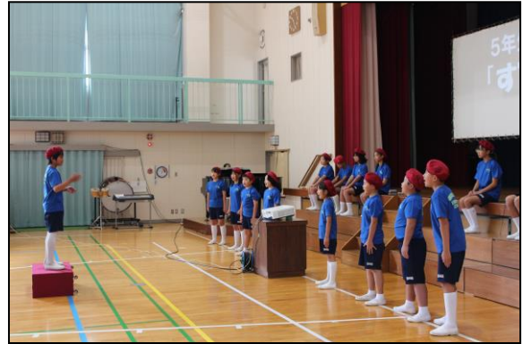
最後は会場の全員で校歌を歌いました