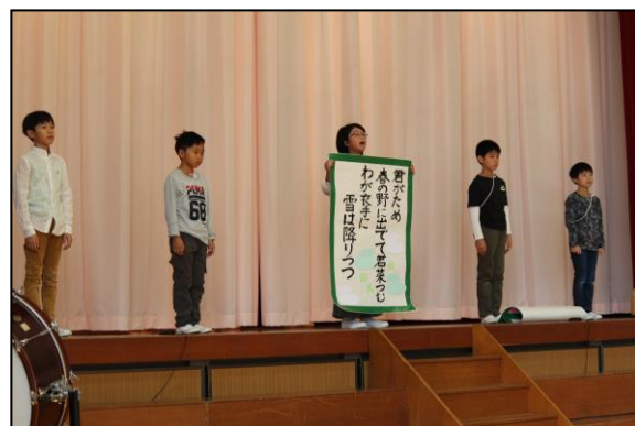
お気に入りの短歌や俳句を発表しました