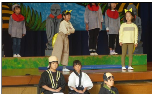
1・2年生 「おばけじぞう」