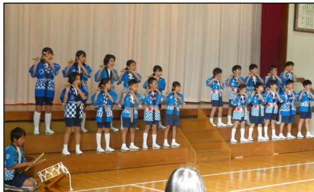
3～6年生 篠笛と常磐獅子