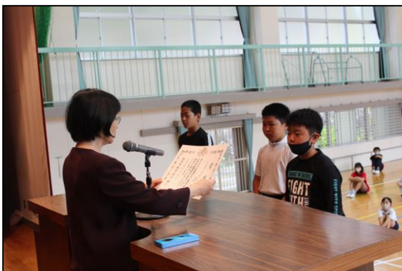
理科作品展の賞状が披露されました