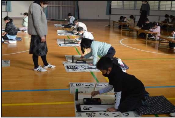
どの子も真剣そのもの、いい雰囲気です