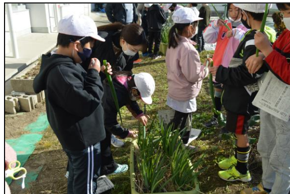
においをかいだり味見をしたり、興味津々です