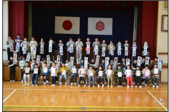
力作をもって記念撮影、みんな誇らしげです