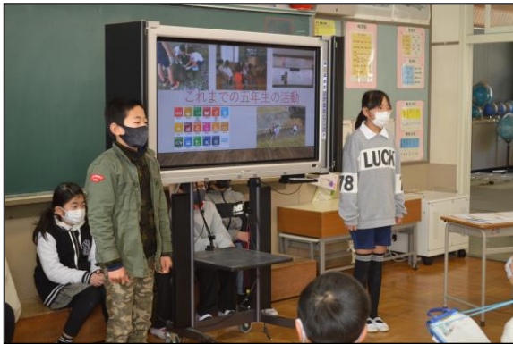
3年生と5年生で活動を紹介しました