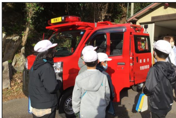
普段、なかなか見られない消防車に夢中です