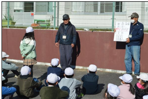
クイズには見事正解、栽培経験が生きていますね