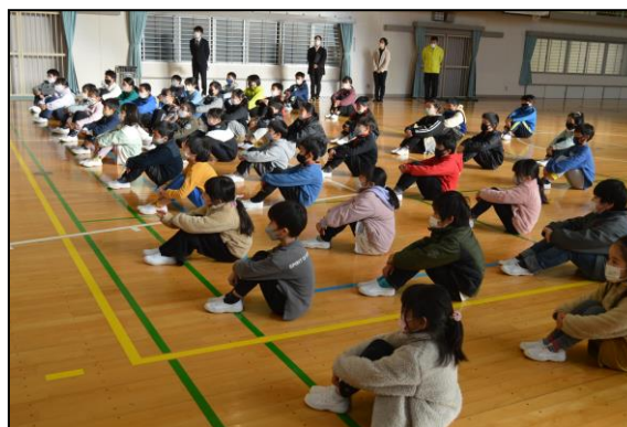
聞く姿勢も〇、いい休みが過ごせそうですね