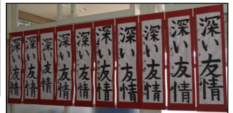
力作ぞろいの校内書き初め展