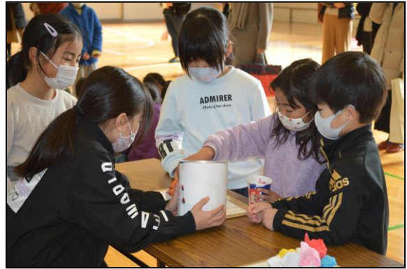
1・2年生は新入学児童を招いて生活科の授業