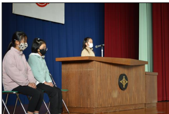
代表の言葉、3人とも素晴らしい発表でした