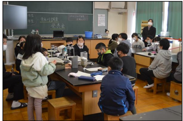
4年生は6年生と、いい情報交換ができました