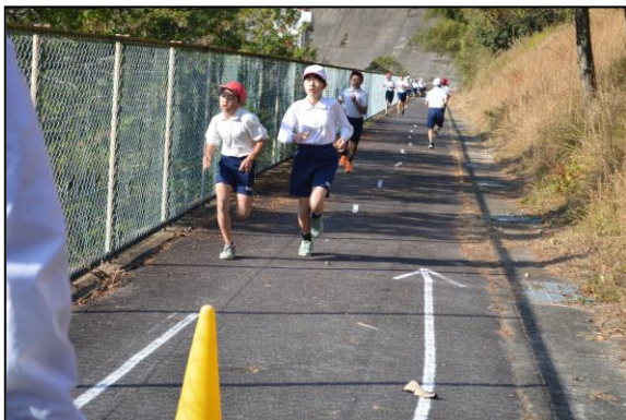
5・6年生 折り返し地点まであと一息