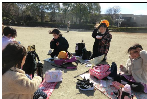
お待ちかねのお弁当、みんなで楽しく