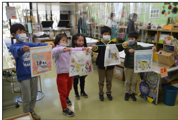
出来上がった作品を手に