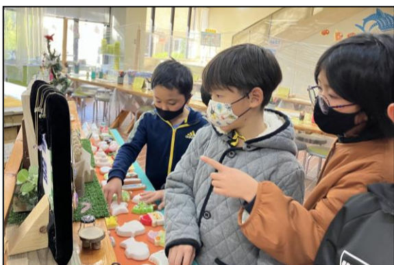
施設内展示の見学もしました