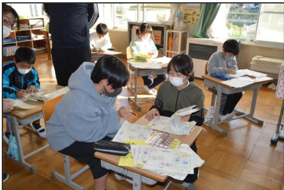
動植物ラリーの用紙をチェックする緑化・美化委員