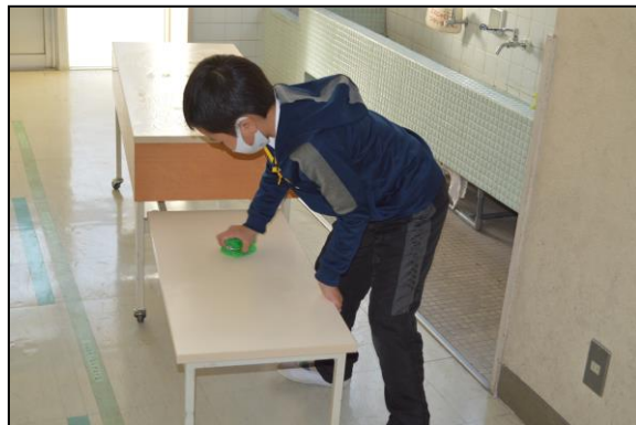
配膳台をきれいにする保健・給食委員