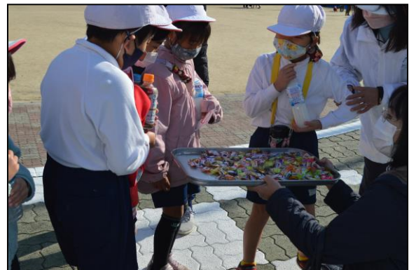
頑張ったみんなにごほうびが……