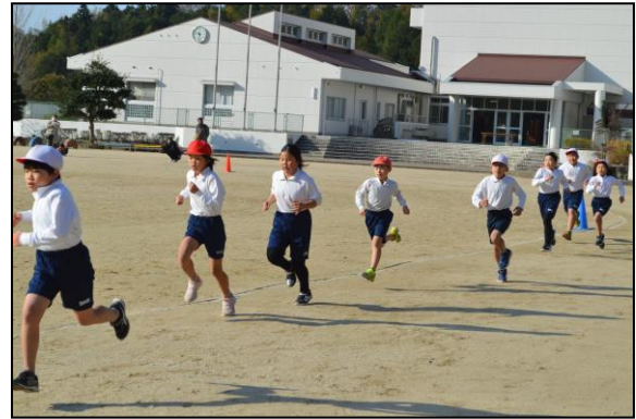
3・4年生 一つでも前の順位を目指して