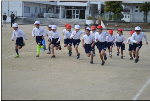
1・2年生 スタートダッシュ