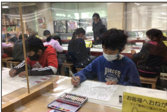
黙々と作品制作を進めています