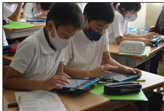
相談もしながらタブレットに考えを入力します