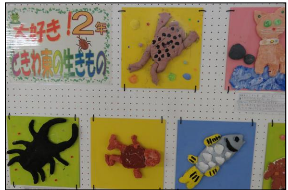
2年生 大好き! ときわ東の生きもの