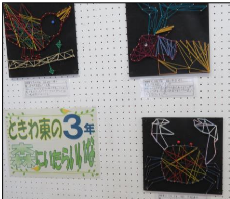
3年生 ときわ東の森にいたらいいな