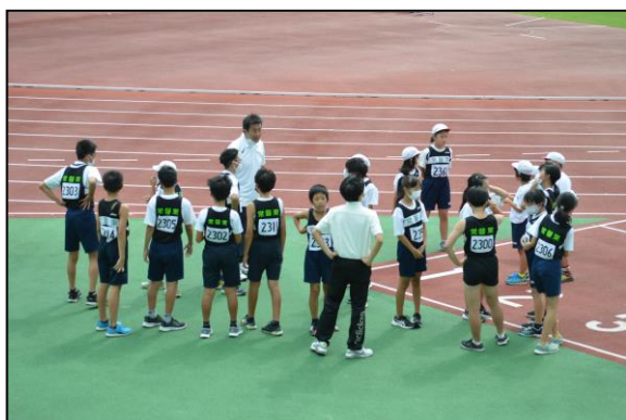
大会直前、和気あいあいとした雰囲気です