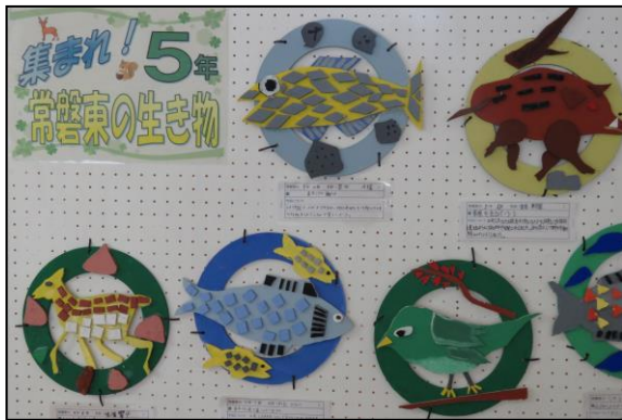
5年生 集まれ! 常磐東の生き物