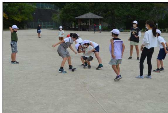
緊張の瞬間、缶を守ることはできたかな