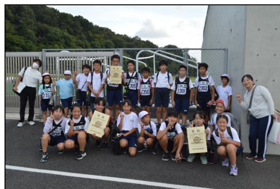
ひがしっ子大健闘、賞状も3枚いただきました