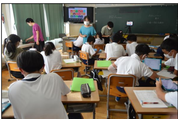
SDGsについてオンラインで学習しました