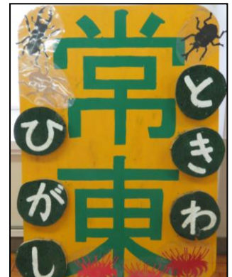
この看板が目印です