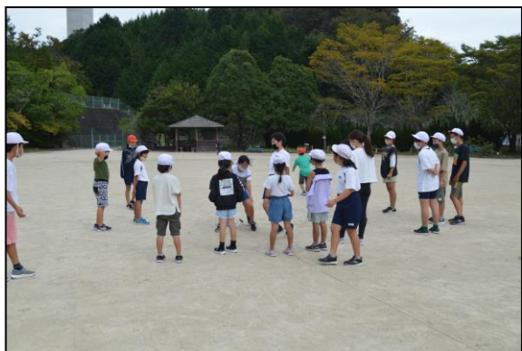
代表委員の皆さんの企画によるレクです