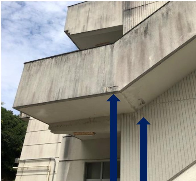
各所のクラック(裂け目・割れ目)補修