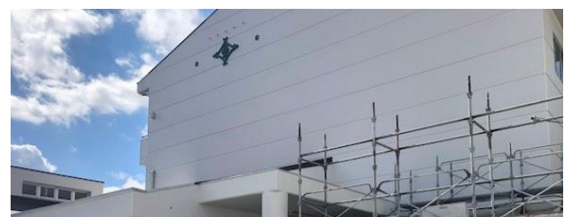
工事は、体育館への渡り屋根塗装・体育館・犬走タイル補修を残すのみ