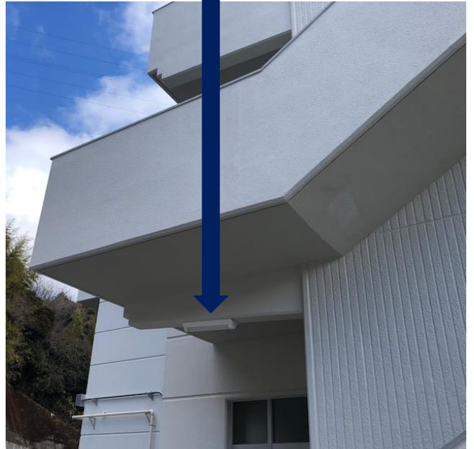
全コーキング再施工