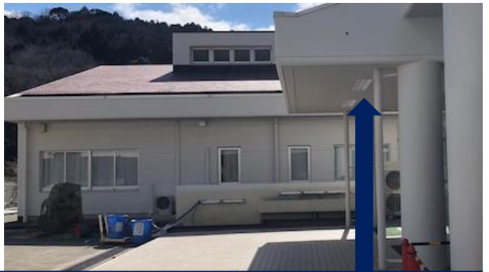
照明器具は、【蛍光灯】→【蛍光灯型 LED】