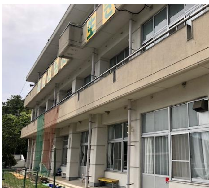
薄クリーム色と薄小豆色のツートン