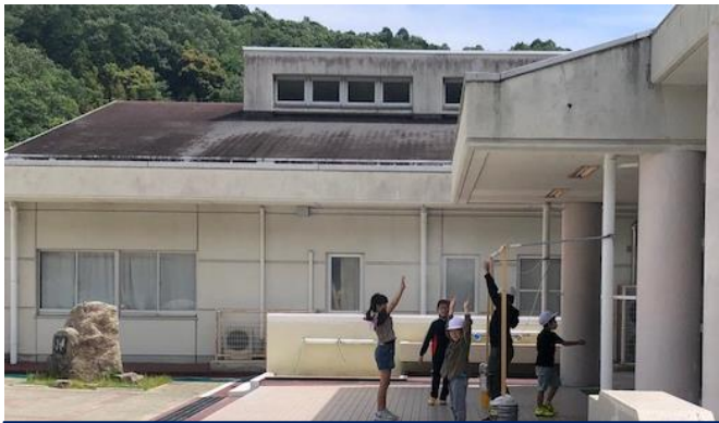
管理棟屋根の張替え