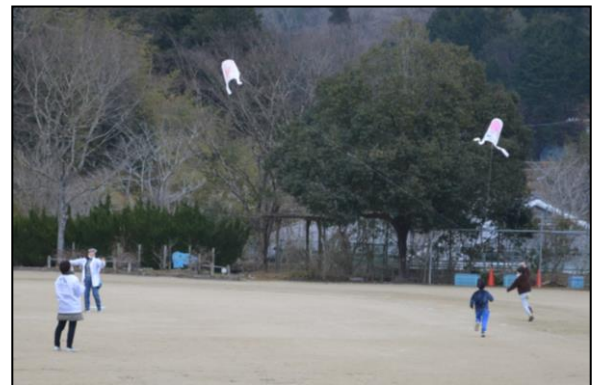
こんなに高いところまで上がりました