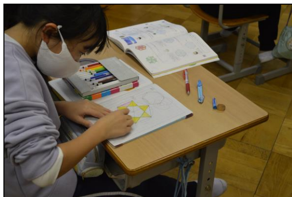
できた多角形に色塗り、楽しく勉強しています