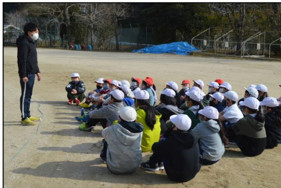
避難の際の動きについて担当の先生と確認します