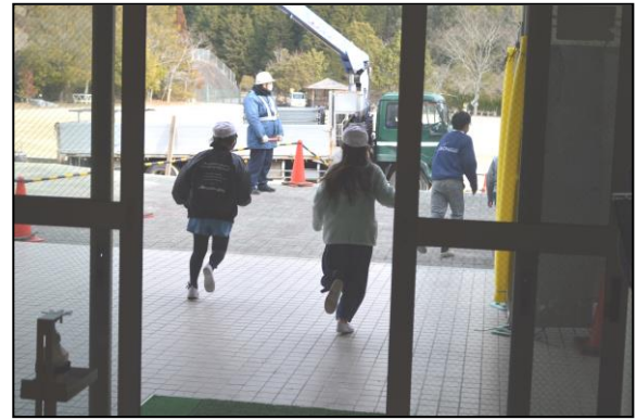
自分たちで考えながら避難することができました