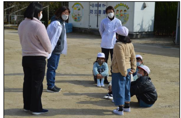
訓練を振り返って、感想もしっかり言えました