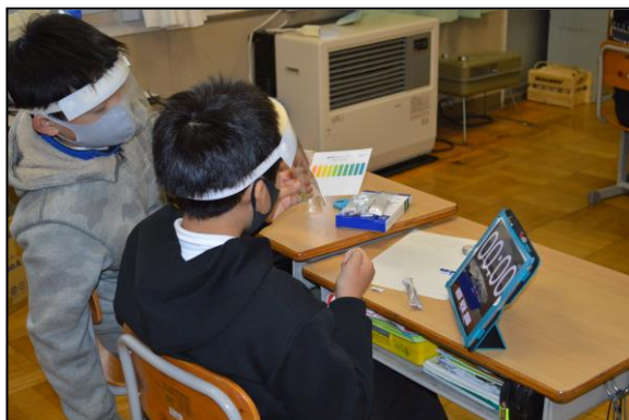
試薬を使ってPHの測定を行っています