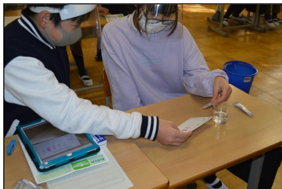
検査の結果、基本的に水質は問題ないようです