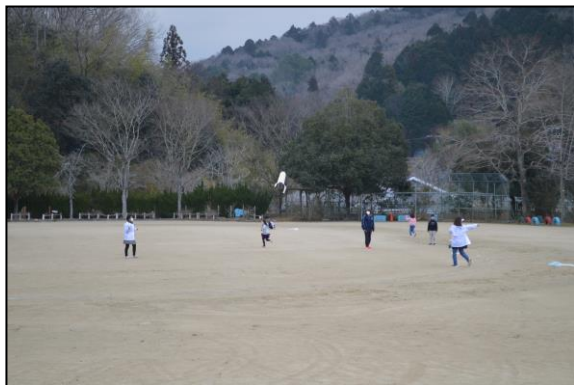
運動場を駆け回る様子も真剣そのもの