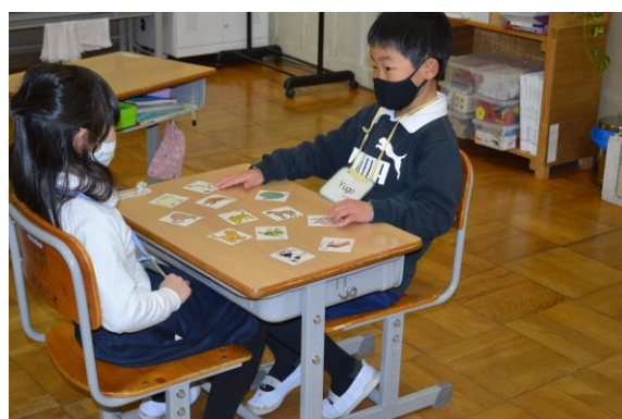
習った単語を覚えるためのゲームを楽しんでいます