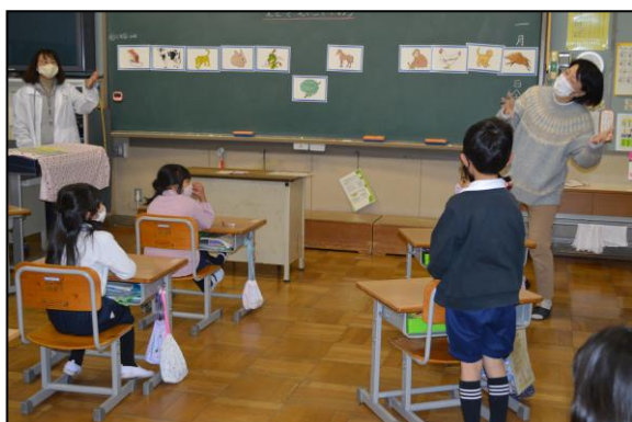
英語で十二支の勉強、難しそうです