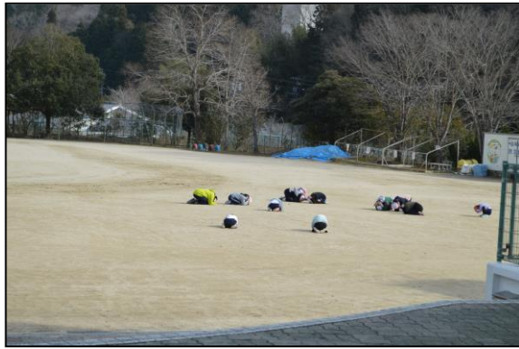
シェイクアウトの訓練が見事に生かされています