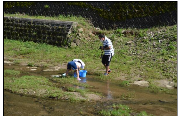
浅瀬にも生き物？先生も興味津々です