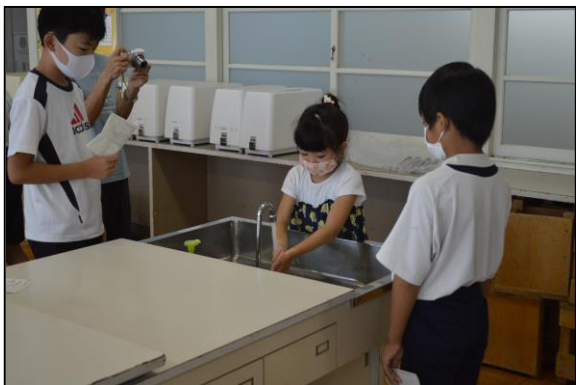
手洗い、上手にできるようになったかな？