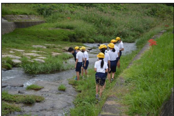
初めは目視で川の様子を確認します