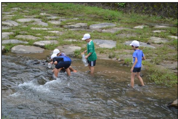
前回の反省から、今回は罟を仕掛けました