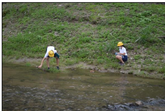
タブレットを片手に、まるで科学者ですね