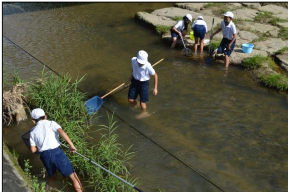
生き物のたくさんいそうな場所に探します