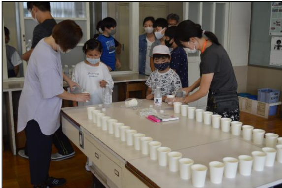
圧倒的な人気は炭酸割でした