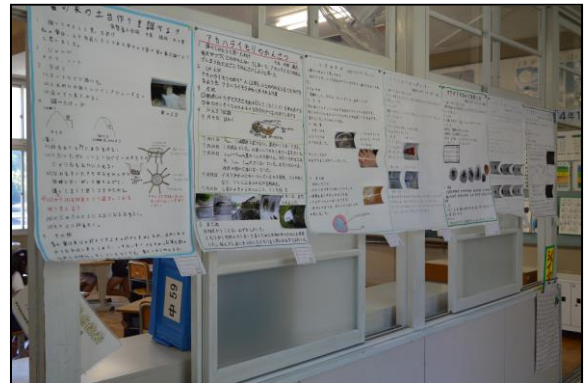
4年生、どれも力作ばかりです