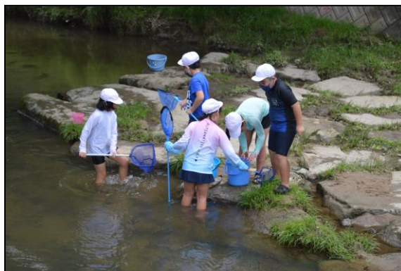
成果を確認中、何か取れましたか？