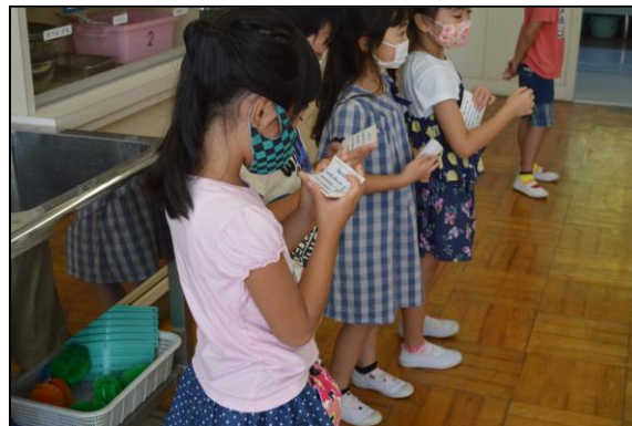
手洗い検定に、見事合格です