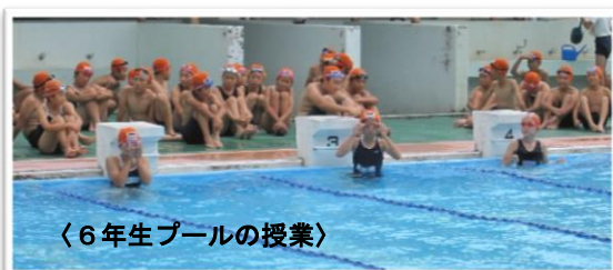
〈6年生プールの授業〉