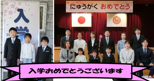
入学おめでとうございます

ぴかぴかの1年生3人(小規模特認校制度による入学者1名)と、やる気いっぱいの在校生、全校児童18名でのスタート。職員は新しく赴任された先生方4名を含め、19名で頑張ります。保護者の皆様、学区の皆様、よろしくお願いいたします。