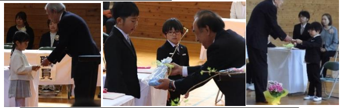
PTA・社教・ライオンズクラブより入学記念品授与