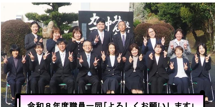
令和8年度職員一同「よろしくお祈りします」