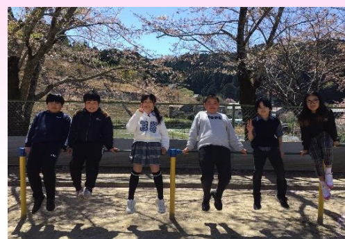
Let's level up! 5・6年生