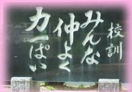
創立150周年 記念石碑