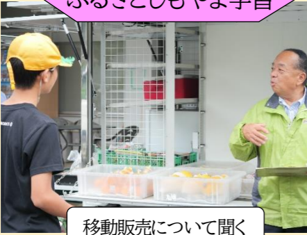
ふるさとしもやま学習