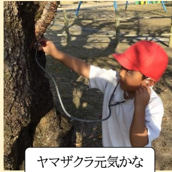
ヤマザクラ元気かな

下山小学校といえば一輪車。下山の子供たちは、入学するすぐの一輪車に乗れるよう練習に励みます。運動会のフィナーレは全校児童による一輪車ドリルです。ともに励まし合い、協力し合って、練習し、技を磨き、本番は見ている人に大きな感動を与えます。