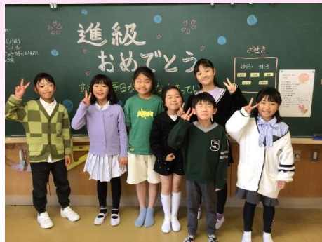
下山☆きらい 3・4年生