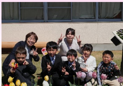
よし！がんばり隊！！ 1・2年生 わくわくパワー ささゆり組