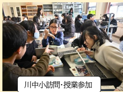
川中小訪問・授業参加

下山の子供たちにとって、他の小学校の子供たちとの交流はとても大切なものです。盲学校には、保護活動しているササクリをもって訪問し、温かく優しい時間が流れます。集合学習や川中小学校の友達との交流はもの見方や考え方が広がり、とてもいい刺激を受けています。