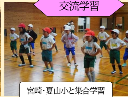
宮崎・夏山小と集合学習