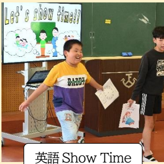
英語 Show Time

下山の子供たちにとって、他の小学校の子供たちとの交流はとても大切なものです。盲学校には、保護活動しているササクリをもって訪問し、温かく優しい時間が流れます。集合学習や川中小学校の友達との交流はもの見方や考え方が広がり、とてもいい刺激を受けています。