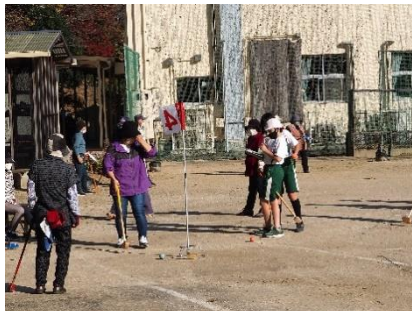
三世代交流グラウンドゴルフ大会 祖父母の方に教えてもらいながら、楽しくプレイします。