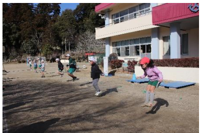
なわとびびっく 2,000回以上前跳びを続ける子もいます。根性ある下山つ子です。2月ごろ、元氣委員会主催で、計画されます。4つの縦割り班がそれぞれ勝利に向けてしっかりと作戦を立て臨みます。