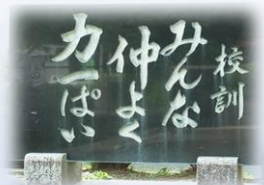
創立150周年 記念石碑