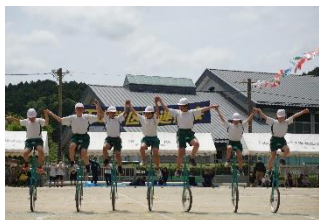
学区大運動会 学区民一同が会える機会です。練習を重ねた、児童の一輪車演技は見ものです。

名古屋市立川中小の4年生を招いて、田植え交流をします。名古屋錦RCのご支援あつての18年間も続く伝統的な活動です。稲苗は、秋まで下山つ子が育て、9月にまた一緒に稲刈りをします。晩会をはじめとする地域の方のご協力に感謝です。