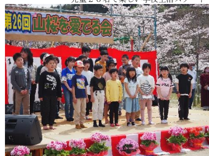
山桜を愛でる会 ←満開のソメイヨシノと五分咲山桜の下に卒業生や下山にゆかりの方が集まります。学区民挙げて多くの屋台や出し物で盛り上がりです。(R6.4.7)