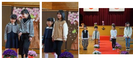
入学式・始業式 新入生2名、小規模特認校制度利用の6名(内2名継続)の仲間入り。全校児童20名で楽しい学校生活スタート