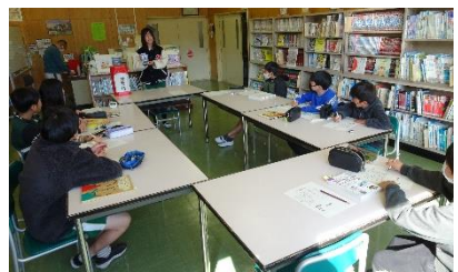
委員会活動 委員会活動は、児童の主体的な活動です。楽しい中に語彙力や説得力が試される「ピリオバトル」は、文化委員会主催です。子供の発想の豊かさから、充実した活動となっています。