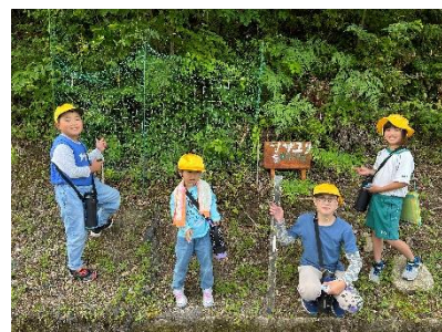
ササユリ調査 全校児童で学区内のササユリの本数調査を継続的に行い、保全・保護を呼びかけています。