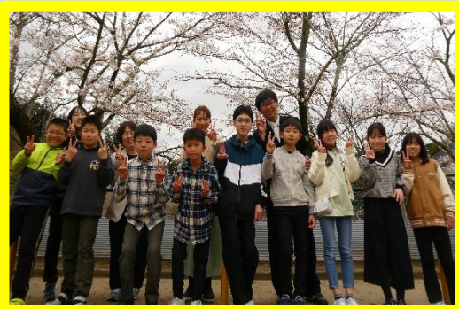
すてきさん 見~つけた 1・2年生