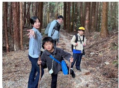
小さなやまがのウォーキング 学校を起点・終点に、学区内をめぐるハイキングをします。多くの人々と一緒に下山の秋を堪能します。高学年は、本校自慢の幻のお米「ミネアサヒ」の販売をし、「ふるさと学習」の発信の場ともなっています。