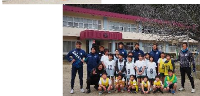
歴史ある学校 地域のコミュニティ 下山小学校は市内2番目となるコミュニティスクールモデル校です。下山つ子は多くの皆様に支えられ健やかに育っています。