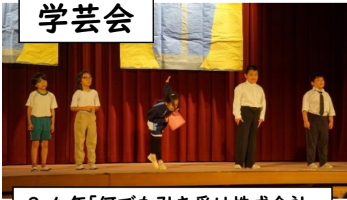
3・4年「何でも引き受け株式会社」