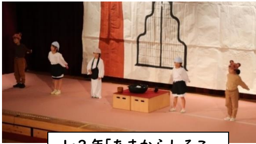
1・2年「あまからしるこ」