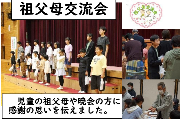
児童の祖父母や晩会の方に感謝の思いを伝えました。