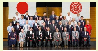
岡崎市制施行108周年記念式 令和6年7月10日

※各地区で掲載したい記事がありましたら、お知らせください。このコーナーで紹介します。