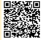
アジアパラ競技大会 公式チケットインフォメーション

※ 二次元コードからアクセスできる Web サイトで応援 ID を登録すると、競技大会の日程などを確認できます。