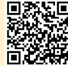
アジア競技大会 公式チケットインフォメーション