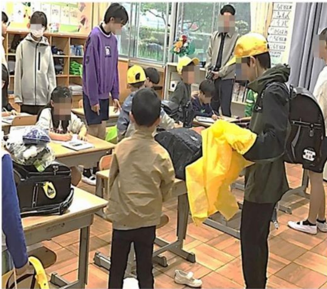
登校中も、教室に入ってから、6年生の温かなサポートが随所で光ります