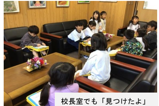
校長室でも「見つけたよ」

さあ、1年生の学習が始まりました。学校探検では、校舎の中のいろいろな教室にあるものを調べたり、広い校地を歩いたりしました。よく目を輝かせて、たくさんものを見つけていました。学ぶことは本当に楽しいです。