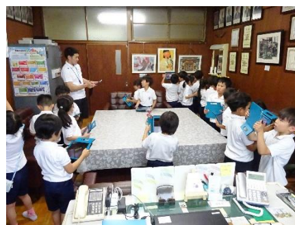
▲校長室を訪れた1年生の子供たち

今、1年生は生活科の学習で校内探検を行っています。先週から今週にかけて、1年生の4学級の子供たちが相次いで校長室を訪れました。そして、校長室の様子を一人一台のタブレットで写真に記録したり、疑問に思ったことを私に質問したりして、積極的に学ぶ姿が微笑ましかったです。学級に戻ってから、たくさんの気づきを発表し合っ、さらに学びを深めてくれることを願っています。