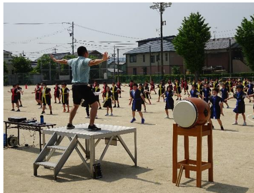
▲指揮台の先生に合わせて踊る3・4年生

このように、子供たちは運動会を通して体を鍛え、技を磨き、そして、心を豊かにしています。運動会が単に学校行事で終わらず、子供たちの成長につながる絶好の機会になっていることが大変うれしいです。