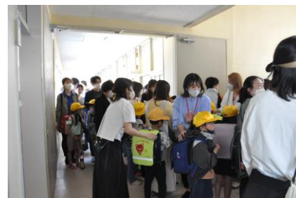
▲児童引き渡し訓練