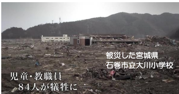
被災した宮城県 石巻市立大川小学校

明日（3 月 1 1 日）で、東日本大震災からちょうど 1 2 年を迎えます。これまでは、3 月 1 1 日が登校日であれば、地震発生の午後 2 時 4 6 分に全校児童が黙とうを捧げてきました。しかし、明日は休日のため、黙とうは地震発生時刻に合わせて各家庭で行っていただけで幸いです。この大震災で亡くなられた方々に追悼の意を表すると共に、震災を通して得た教訓を語り継ぎながら、私たちの日常生活に生かしていきたいと思えます。