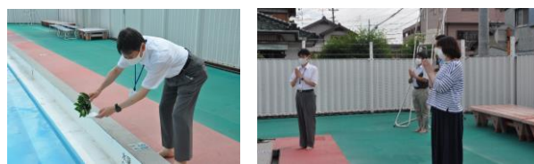
▲6/29 役職者と体育主任で行ったプール開き