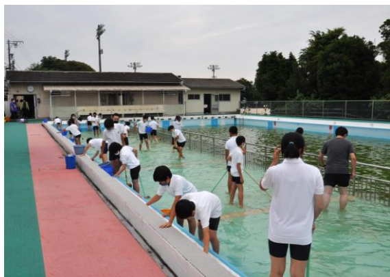
▲6/22 水泳部によるプール掃除