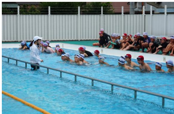
▲6/30 今年初めてとなる水泳の授業（6年生）