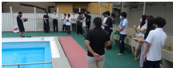
▲6/28 指導・管理に携わる職員が参加しての講習会