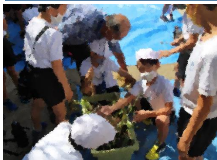
9月11日(金)4年生法性寺ねぎ栽培活動おかざき農游会の方をお招きして、岡崎の伝統野菜の1つである法性寺ねぎの栽培活動を行いました。

こんな子供たちや地域の方に感化されて、私も交差点でがんばろうとしているのが、挨拶です。「いつでも、どこでも、何度でも」がこれまで私の挨拶のモットーでしたが、これに「だれにでも」を加えることにしました。交差点には、徒歩や自転車で通勤通学される方がたくさん通ります。初めて見る方ばかりですが、目を見て「おはようございます」と挨拶します。しばらく続けているうち、先日、後ろから高校生に「おはようございます」と先に挨拶されました。一瞬ドキッとしたしましたが、気持ちを通じ合えた気がして、なんだかとてもうれしい気持ちになりました。朝のわずか十五分ほどのことですが、交差点に立つことに心地よさを感じています。