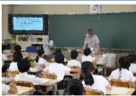
9月29日(火)4年生環境出前学習 岡崎市環境政策課の方をお招きして、わたしたちのくらしと水について学びました。