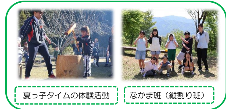
夏っ子タイムの体験活動 なかま班(縦割り班)