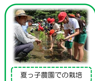
夏っ子農園での栽培