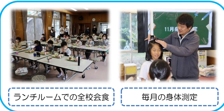
ランチルームでの全校会食 毎月の身体測定