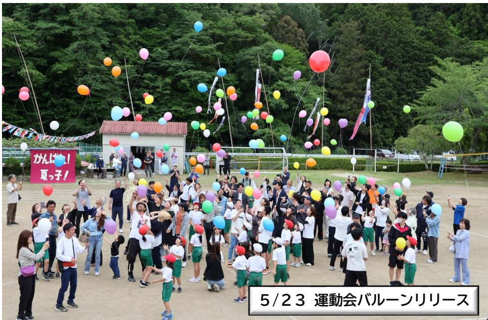
5/23 運動会バルーンリリース