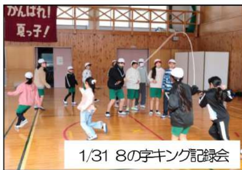
1/31 8の字キング記録会