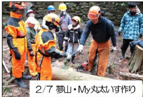
2/7 夢山・My丸太いす作り