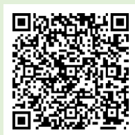
「ラーケーションの日」 ポータルサイト

「ラーケーションの日」には、様々な活動ができます。どのような活動ができるのか、どうやって「ラーケーションの日」を取ればよいのかなど、興味をもった人は、おうちの方に配った「保護者用リーフレット」を見たり、右の二次元コードから、「ラーケーションポータルサイト」を見たりしながら、おうちの方と話し合ってください。