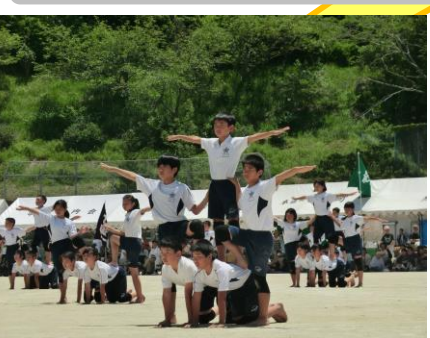
学区民合同運動会