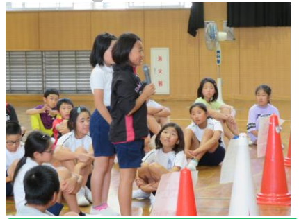
岡崎特別支援学校との交流