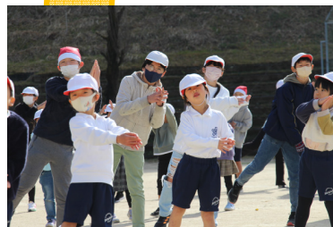
スマイル英語集会