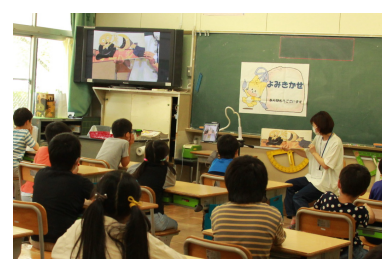
PTAよみきかせ「さくらの会」