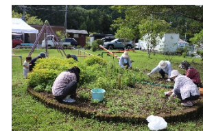
親子三代環境整備