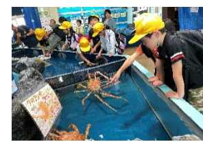
わくわく発見学習