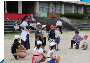
全校遊び（しっぽとり）