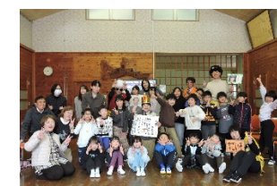
6年生とのお別れ会