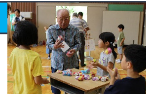
みやざき敬老まつり