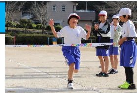
校内マラソン大会