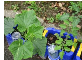
「ととちゃん」「なっちゃん」名入り野菜~2年