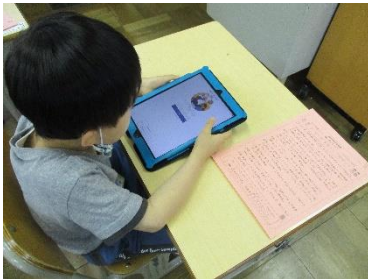
1年生も自分でパスワードを入力して…頑張っています