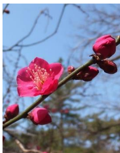
プール横で紅梅が咲き始めました…

今年度は休業明けから出しており、美合っ子がよく使ってくれました。先生たちも頑張ったよ、分かったかな？大切に使ってください