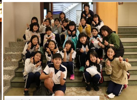
温泉宿での風呂上がり