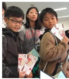
GOTO トラベルの恩恵で、地域共通クーポンももらえホクホク

修学旅行に行ってきました。 「あをによし…」の歌で知られる古の都・奈良と、三重県、伊勢神宮方面への「学を修める旅」です。 二日間とも天気に恵まれ、全ての行程をほぼ予定通り(早め早めくらい)に実施できました。何よりうれしかったのは、大きな病気やけがもなく、全員が元気に行けたことです。子供たちが自分の体調管理を頑張ったのはもちろん、様々な方の多大なご協力あってこそです。今年ならではの楽しい経験もたくさんできました。と思います。 鹿せんべいにぞろぞろ鹿が寄ってきて恐怖を味わった子、カモメにエサを渡そうとして指をつつかれそうになった子、水族館でクリオネを一生懸命撮影していた子、おかげ横丁でコロッケやタピオカなど買いまくっていた子…どの子も笑顔が弾けていました。