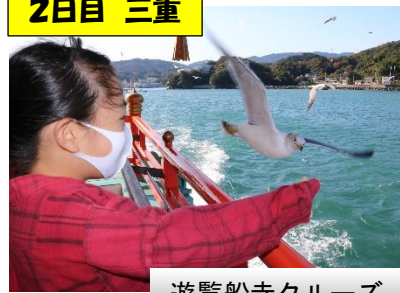
遊覧船寺クルーズ