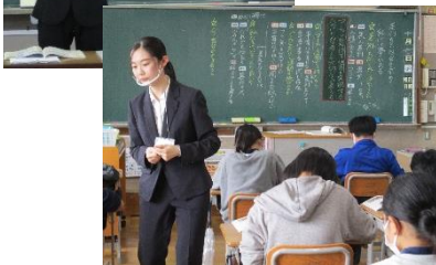
教育実習生さん 9.28~10.14 先生の卵さんが、現場実習に来て います。頑張ってます。

ホタル放流会が行われました。蛍飼育部の子どもたちが中心となって、育ててくれていた蛍の幼虫とカワニナを川に還します。蛍保存会やPTA役員の皆様にも参列していただきました。まずは来賓の皆様、四・五・六年生、そしてホタル飼育部員と、順次川岸で、蛍の幼虫やカワニナを放流しました。「無事に育つてね」「元気でいろよ」「来年また会おう」など、皆、声を掛けながら放流できたと思います。来年の夏、元気に、そして、たくさん飛んでほしいですね。今後四年生が環境学習の一環として、マイホタル活動に取り組み予定です。「生田蛍は美合の宝」を学校・学区で具現化しています。