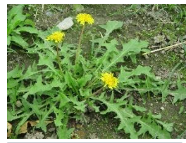
実験農地のたんぽぽ

美合小の特色である生田蛍保護活動。今年度で四十四年目を迎えます。毎年、鳥川・河合の保存会の皆様はじめ、多くのご来賓をお迎えして行ってきた保存会総会を中止、子供らが楽しみにしている蛍観賞会も、中止せざるを得ませんでした。全体で行うことはできませんが、ぜひご家族で山綱川流域をお散歩されてみては如何でしょうか。夜八時頃がよく見える時間帯です。蛍に、光を直接当てたり、捕まえたりせずに、「今年も飛んでくれてありがとう」という気持ちでゆったり見守ってください。 今年も、六月上旬位がピークなので、と思っています。