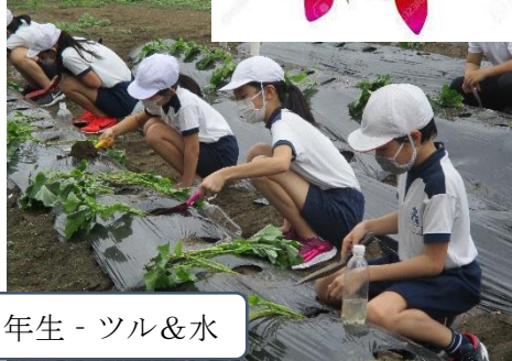
6年生 - ツル&水

今年度も実験農地にサツマイモを植えました。(27・28日)1・6年生と一緒に植えたかったのですが、密を避けるために、6年生がツルサシを行い、その後に1年生が水をあげるという時間差で行いました。甘くておいしい「紅はるか」という品種です。秋の収穫が楽しみです。