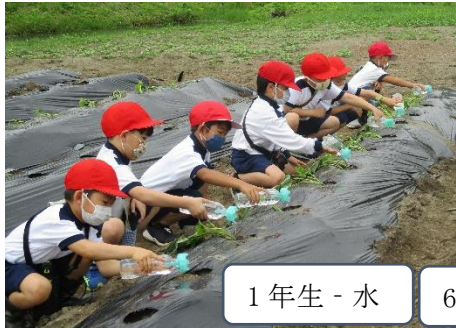
1年生 - 水