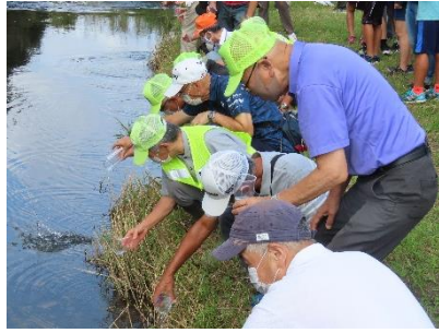
「また6月に会おうね」生田蛍保存会、ホタル飼育部、6年・5年の順に放流。