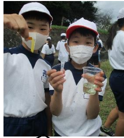
水が黄色に変化！その意味は？！

四年生はサイエンスセミナーがあり、五日に蛍放流をしました。水質調査も行い、排水溝近くの水はきれいでないことが分かりました。環境学習やマイホテル学習につなげられそうですね。