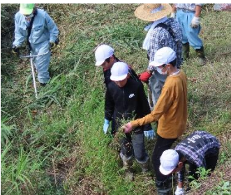
過日の台風で川岸の草は流され片付けは楽でした？

クリーンアップホタル川(PTA奉仕作業) 9.26 (月) ※22日から延期しました。