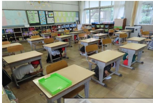
地震発生 まずは自分の命を守ります