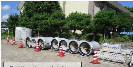
①夏休み前に、資材搬入