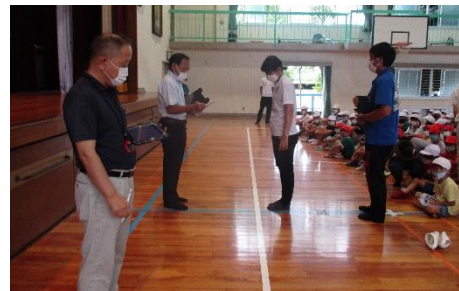
点呼・報告 全員の安全を確認して避難完了です