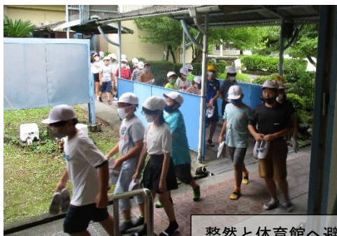
整然と体育館へ避難