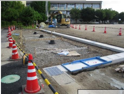
③マンホールが取り付けられました