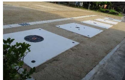
④5つのトイレが完成～ 使われる日が来ないことを願って