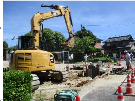
②穴を掘り、既存の下水管との接合を確認