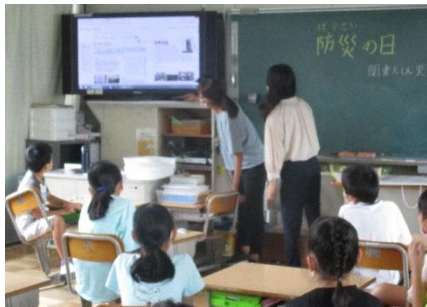
事前に各学級で、地震時の避難について学習 します。9:50の地震発生を待ちます…