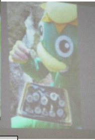
カッパもヘビも、生き物 みーんな、大すき！！