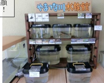
～山綱川水族館～が登場！