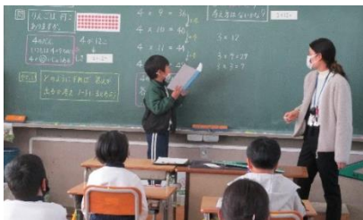
自分の考えを説明 2年生算数