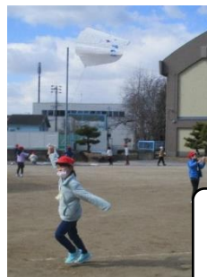
子供は風の子 1年生