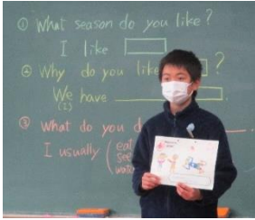
英語の道案内スピーチ 5年生