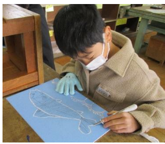
版画に挑戦 5年は一版多色の木版 1年は紙版画