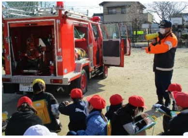
消防団の方に話を聞く 2年生