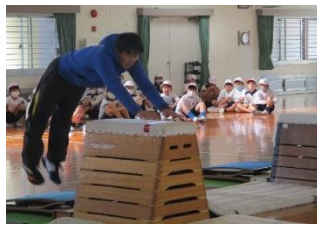
跳び箱 先生の模範演技、ご覧あれ 4年生