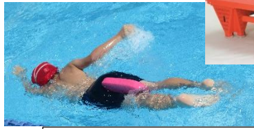
ミニビート版 (足にはさんで)