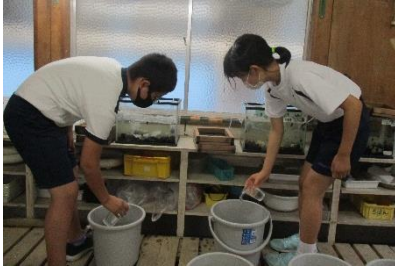
蛭飼育部 カワナナ水槽の水替えは地道でも大変大切な活動