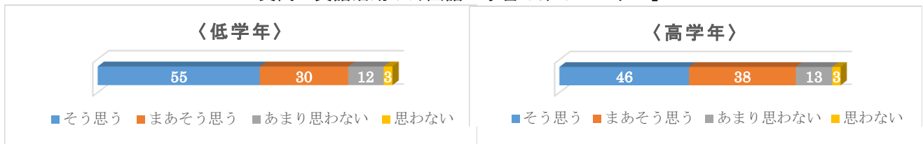
【資料1】児童アンケート 質問「英語活動や外国語の学習は楽しいですか」

児童にアンケートを行ったところ、「英語活動・外国語の学習は楽しいですか」という質問に対し、低学年で「楽しい」、「とても楽しい」と回答した児童は、全体の85%、高学年では84%でした。このことから、児童は概して英語活動を楽しみながら、DVDの英語が使われる場面・会話の内容を理解して英語を聞き、話しているといえます。また、低学年から続けてきた英語活動が、高学年になっても学習に生かされ、外国語科の学習に対する意欲の継続につながっていると考えられます。