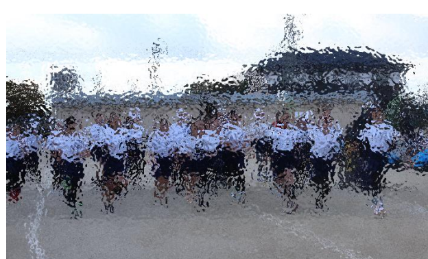
12月4日(木) 校内持久走大会を開催しました