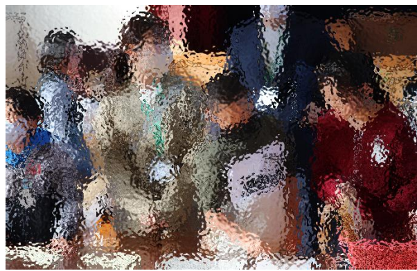
11月20日(木) 就学時健康診断で5年生が手伝いをしました