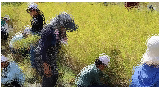
10月8日（水） 5年生が稲刈り体験をしました

災害はいつ発生するか分かりません。学校にいる間は、職員が子供たちの安全確保に努めます。しかし、子供たちの生活の中で、学校にいる時間は、全体の4分の1に届かないほどです。ご家庭、地域での防災意識が大切になります。この機会に、ご家庭でも防災についてお話をしていただけると幸いです。