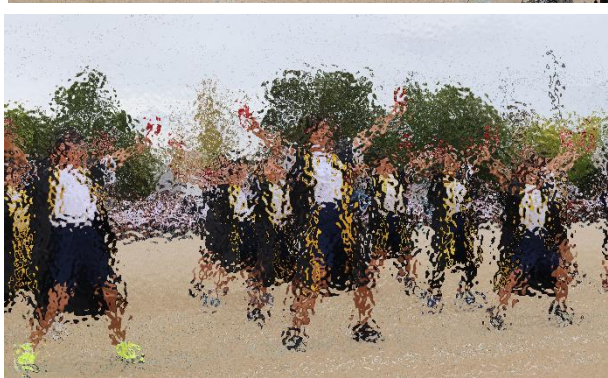
10月25日（金） 運動会を盛大に開催しました