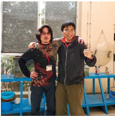
共に管理をしてくれた家康先生と