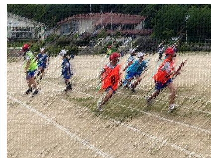
全校リレー練習のひとコマ。どの子も一生懸命に走り、バトンをつなぎます。がんばれ！