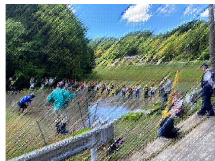
睦会の方々に教えていただきながら、無事田植えを終えることができました。ありがとうございました！