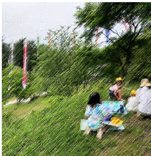
日近の里での一コマ。画用紙いっぱいにクレヨンでこいのぼりを描いていきます