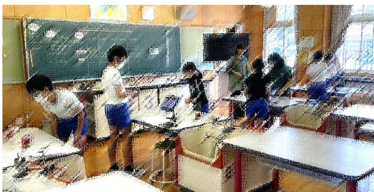
6年理科 ものの燃え方について、仮説を立てて実験に取り組みます