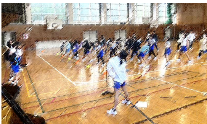
4月15日 今年最初の朝会が行われました

さて、今週も、任命式や1年生を迎える会、見守り隊の顔合わせ会など様々な行事が計画されています。中には疲れがたまってきたお子さんもあるかもしれませんが、その後にはGWが待っています。形埜小の子どもと職員が一丸となって、4月を駆け抜けたと思います！