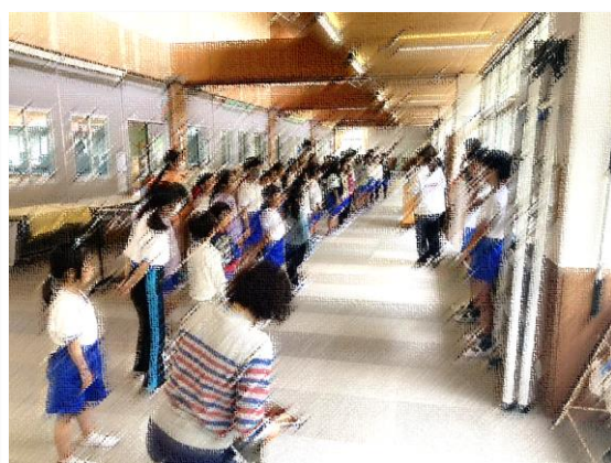
ワークスペースでは全校で校歌を練習しています