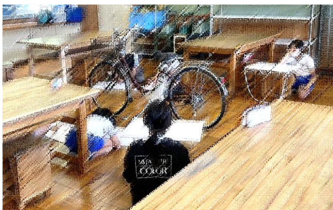
4年図工のひとコマ。どこから描こうかな？