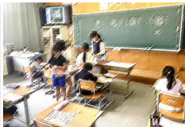
2年国語 新出漢字を丁寧に学んでいます