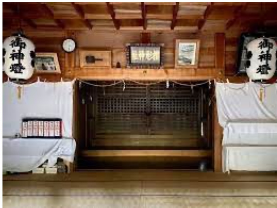
↑桜形神社の中 Inside the Sakuragata Shrine

この写真に写っているのは階段ですが、登るのが苦手な方は、右に坂があるのでそちらがおすすめです