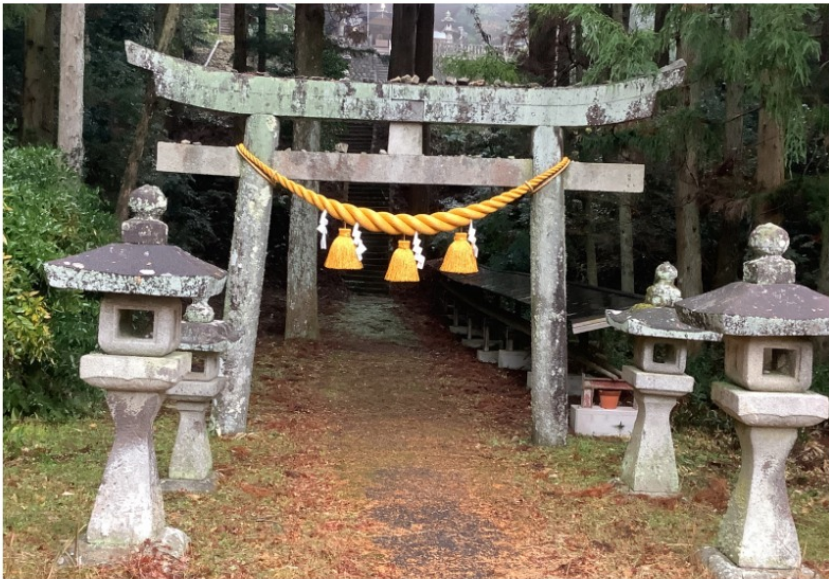
↑ 桜形神社の門 (Sakuragata Shrine Gate)

一年間では、催し祭りが、五つあります。その五つには、月並祭・祈念祭・例大祭・新嘗祭・初詣、初宮参りがあります。月並祭は、感謝の祭りで毎月1日、31日にやる祭りだそうです。例大祭は、特別な感謝祭で年に一回、10月15日にやると聞きました。祈年祭は、春の耕作始めに五穀豊穰を祈るお祭りです。新嘗祭は、その年の収穫に感謝して新穀を神様にお供え来年の豊穰を願う行事です。初宮参りは、赤ちゃんが生まれておよそ一カ月後に神社でご祈祷する行事です。そして、初詣はその年はじめて神社仏閣へ参り、新年の無病息災や平安無事などを祈る事です。このことで、いろいろな歴史、祭りがある神社だと分かりました。