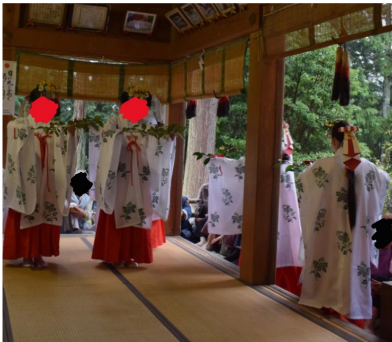
↑ 巫女舞 Shrine maiden dance みこまい

私は6年生として桜形神社で巫女舞をやりました。基本座る時には正座で、 せすじ 背筋も ねこせ 猫背にならないようしっかりと伸ばさないといけないので、大変でした。実際に千早 ちはや という衣装を着て舞いをしてみると椅子に引っかかったり、踏んでしまったりしてしまう時もあり難しかったけれど、いい経験だったなと思います。