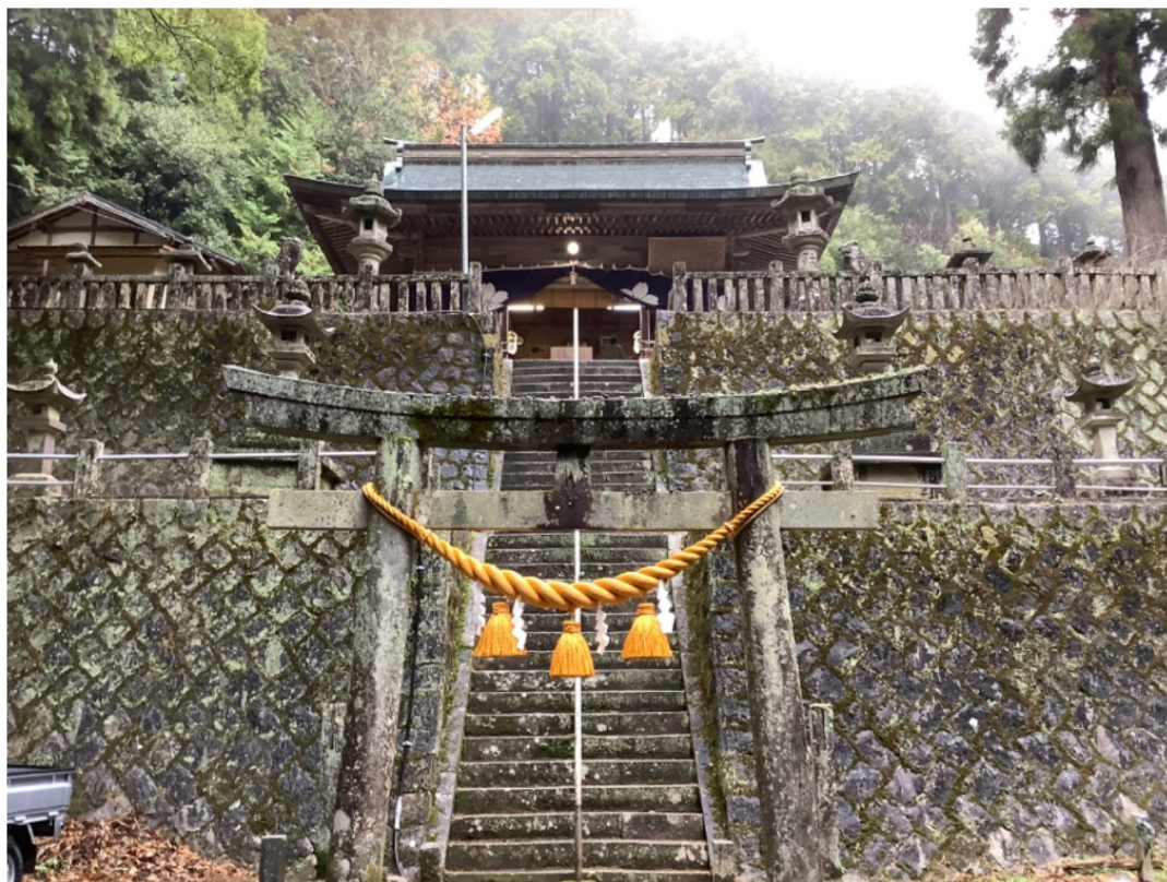
Actual Sakuragata Shrine