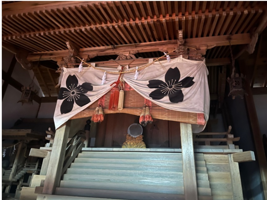
↑祭壇(神をまつる場所)

桜形神社には社記という物や祭壇、弓技場などがあります。社記に書いてある文字は漢字を多く使い、昔の文字で書いてありました。社記とは、神社の歴史を詳しく書いた物です。