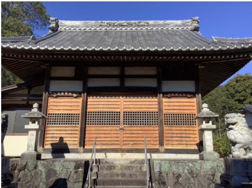
本堂(The main hall)

大川神明宮は、古くからあり、明治15年（1882年）に作られました。大正11年（1922年）に市川団吉一座が上演するなど昭和30年（1955年）まで舞台として使用されたそうです。大川神明宮は舞台が回る回り舞台で有名です。他にも色々な仕掛けがあって面白いです。また、県の有形民俗文化財（ゆうけいみんぞくぶんかざい）に指定されているそうです。是非見に来てください。高さ10、9mの母屋造でできています。