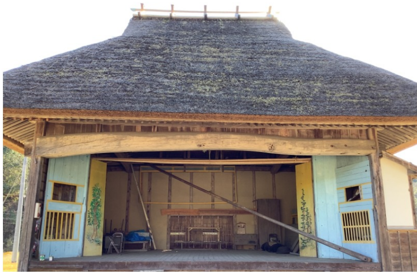
大川神明宮の周り舞台 (Surrounding stage)

大川神明宮は、古くからあり、明治15年（1882年）に作られました。大正11年（1922年）に市川団吉一座が上演するなど昭和30年（1955年）まで舞台として使用されたそうです。大川神明宮は舞台が回る回り舞台で有名です。他にも色々な仕掛けがあって面白いです。また、県の有形民俗文化財（ゆうけいみんぞくぶんかざい）に指定されているそうです。是非見に来てください。高さ10、9mの母屋造でできています。