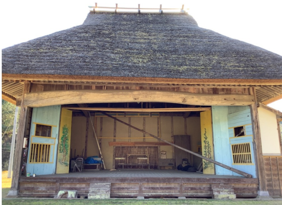
大川神明宮の周り舞台 (Surrounding stage)