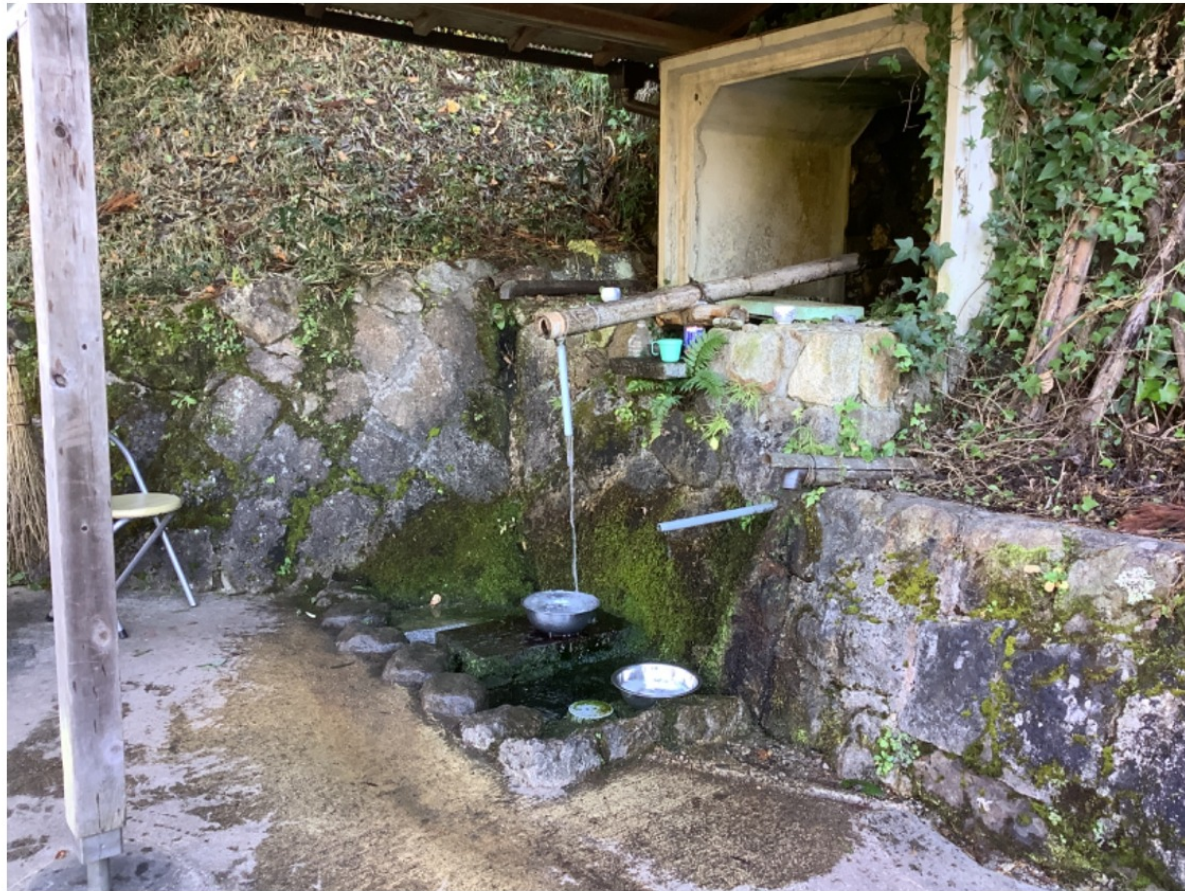
水汲み場 (water drawing place)