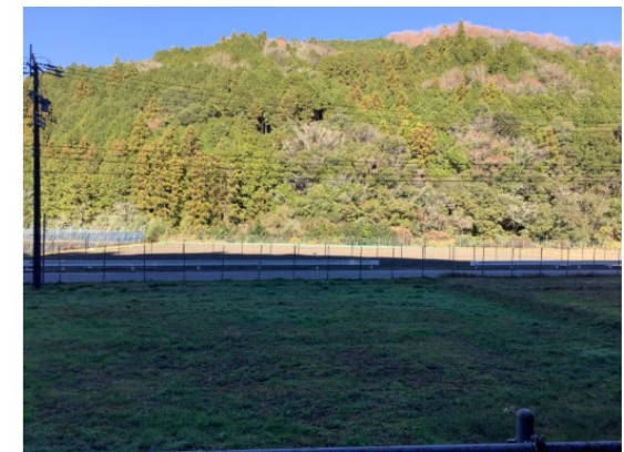
綺麗な景色 (beautiful scenery)