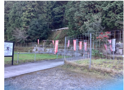
霊水を遠くから見た様子 (View from a distance)