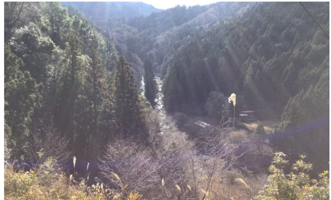
↑ 上から見た景色 (view from the top)

実際に見てみて歴史を見るだけでなく景色がすごくよかったり日近城跡を見た時そこに説明が書いてあったりとわかりやすくてすごくよかったです。あと、登る時には、足場がしっかり整備していました。なので、登りやすく道がわからない時は管理人の人に聞くとわかりやすく教えてくれて行きやすかったです。