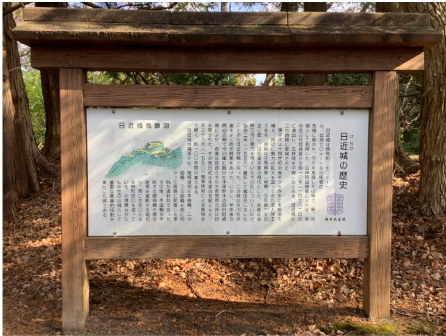
↑ 頂上にある看板 (signboard)